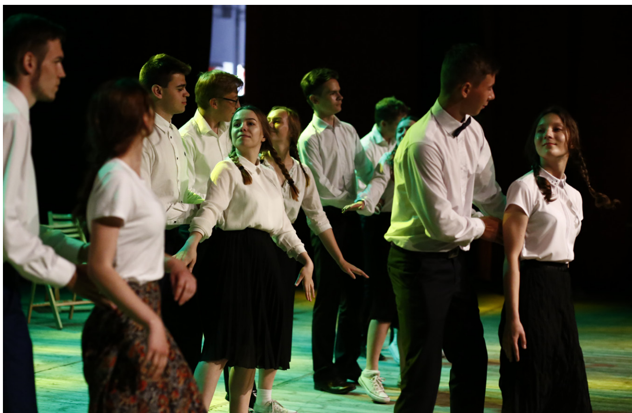
Na jubileuszu nie zabrakło też występów artystycznych najmłodszych uczniów szkoły

Jesteśmy dumni z naszej Szkoły i ze wszystkich jubileuszowych działań – podkreślają organizatorzy uroczystości. - Uczestnicy jubileuszu, którzy przybyli z całej Polski, a także z USA i Afryki, sprawili, że miał on zasięg regionalny, ogólnopolski i między-