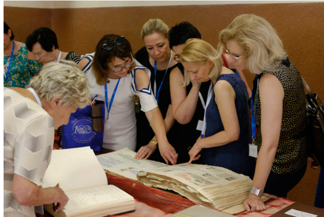
Dawni absolwenci z rozzerwieniem przeglądali szkolne kroniki

8 czerwca na deptak miejski wkroczyły Korowody dla Niepodległej, które utworzyli uczniowie z poszczególnych szkół i przedszkoli. Wśród tańczących poloneza, aż 87 par tworzyła nasza młodzież.