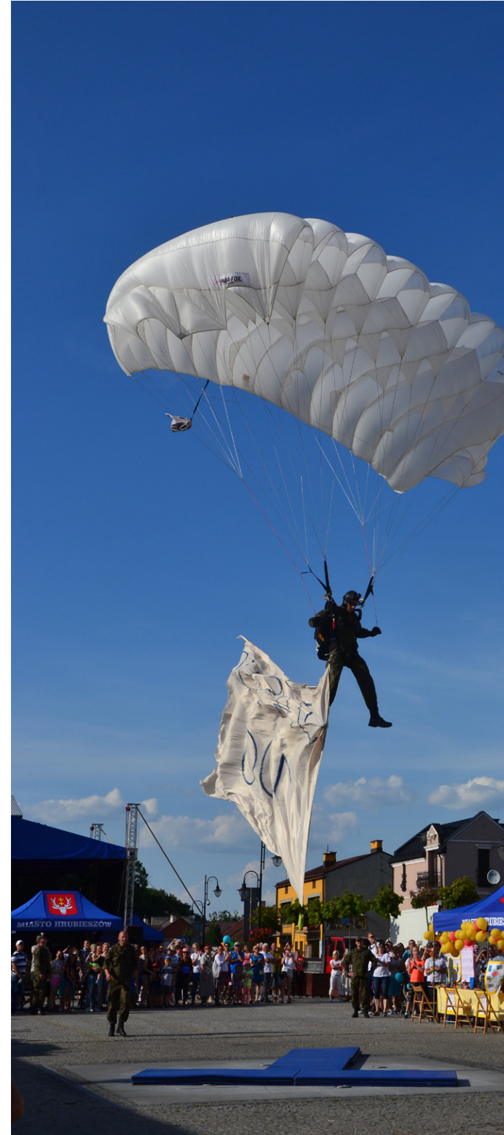
Jedną z atrakcji jubileuszu było skoki spadochronowe przygotowane przez II Pułk Rozpoznawczy z Hrubieszowa.

Także 10 czerwca, na deptaku naszego miasta, odbył się koncert „Absolwenci i uczniowie Staszica Miastu”. Rozpoczął się piosenką