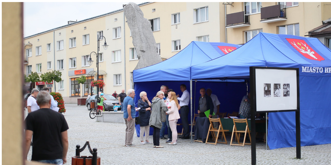
W spotkaniu dotyczącym przyszłości Sutek wzięło udział wielu mieszkańców miasta

W spotkaniu uczestniczył ekspert z Ministerstwa Inwestycji i Rozwoju.