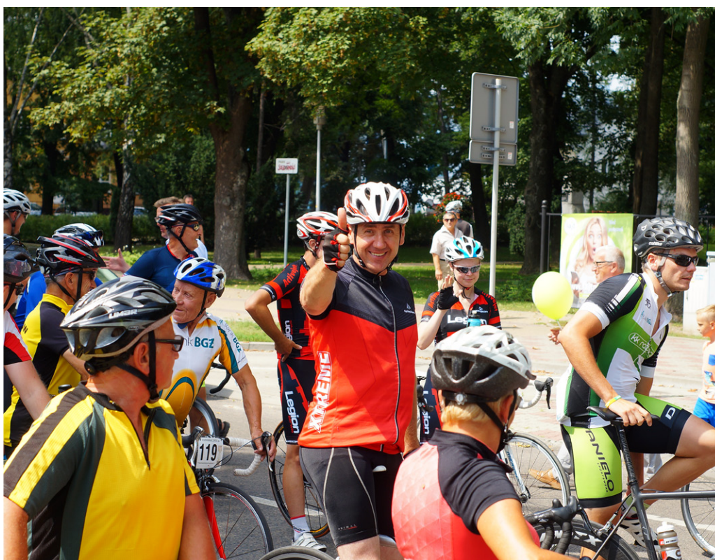
W wyścigu – w barwach OSP Hrubieszów - wziął udział m.in. Tomasz Zajac, burmistrz Hrubieszowa. Zwycięzca wyścigu miał czas lepszy od burmistrza zaledwie o 11 minut.

Wszystkie wyniki można zobaczyć na: http://www.pomiarczasu.pl/wyniki/2018_08_05_hrubieszow/HR67Kat.pdf i http://www.pomiarczasu.pl/wyniki/2018_08_05_hrubieszow/HR28Open.pdf