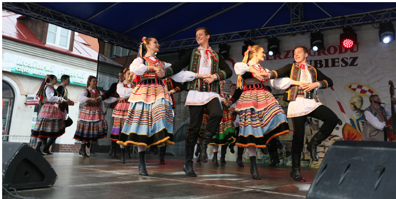
Rubienalia co roku cieszą się dużą popularnością wśród mieszkańców Hrubieszowa

XVII edycja konkursu recytatorskiego „Ziemia Hrubieszowska w poezji i prozie” - Cykliczna impreza, której przyswieca krzewienie idei regionalizmu, ukazanie historii i piękna „malej