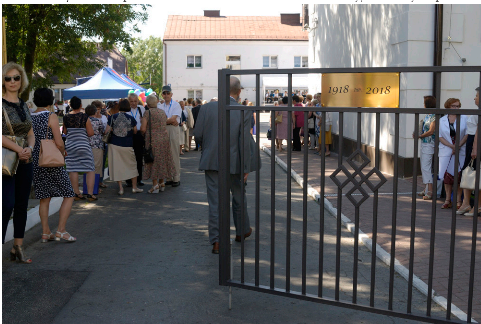
Wielu uczniów wciąż pamięta, jak po raz pierwszy – przed laty – przekroczyli bramy tej szkoły