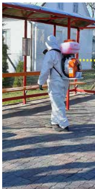
Pracownicy odkazili już miejskie ławki, przystanki i place zabaw.

Miasto wspomaga także finansowo hrubieszowski szpital. Zakupione zostały przyłbice, które zostaną przekazane naszym służbom na pierwszej linii walki z koronawirusem. Do działań prewencyjnych włączyła się również Straż Miejska, której funkcjonariusze patrolują miasto, podając aktualne komunikaty o zagrożeniu.