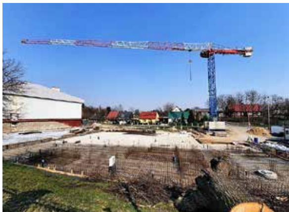
Jeśli nie będzie opóźnień, inwestycja będzie oddana do użytku w 2022 r.

Trwają też prace na ulicach Storczykowej, Konwaliowej i Tulipanowej z przebudową dwóch skrzyżowań, budową chodników, kanalizacji deszczowej i zjazdów do posesji i oświetlenia ulicznego; wkrótce zakończy się także budowa dróg w ul. Gródeckiej.