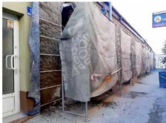
W centrum miasta wciąż trwa remont i adaptacja lokali w Sutkach, które są własnością miasta.