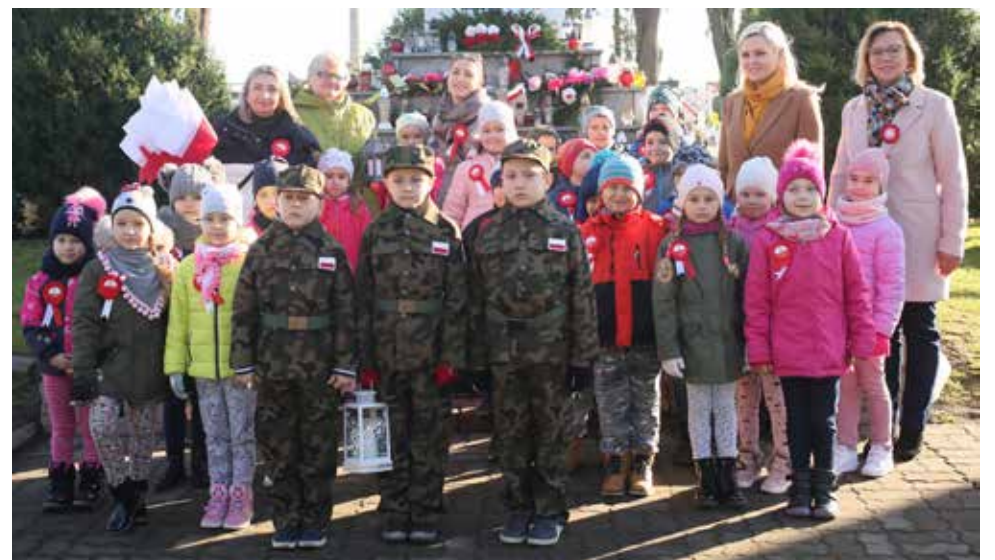
Organizatorem wydarzenia w naszym mieście było Miejskie Przedszkole nr 1 w Hrubieszowie.

5 listopada na Cmentarzu Wojskowym w Hrubieszowie odbyło się przekazanie przez harcerzy ZHP Zgierz Ognia Niepodległości hrubieszowskim szkołom i przedszkolom.