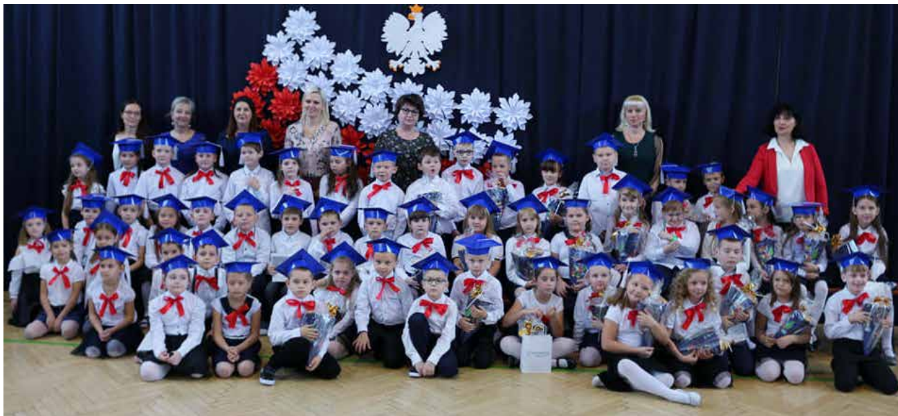
Wspólne zdjęcie pierwszaków ze SP 3