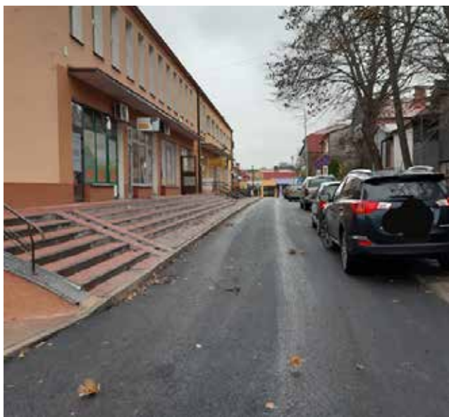
Oddano już wyremontowaną ul. Berka Joselewicza

ulicą Storczykową i Konwaliową oraz Storczykową i Tulipanową. Zakończenie prac planuje się do końca sierpnia 2020 r.