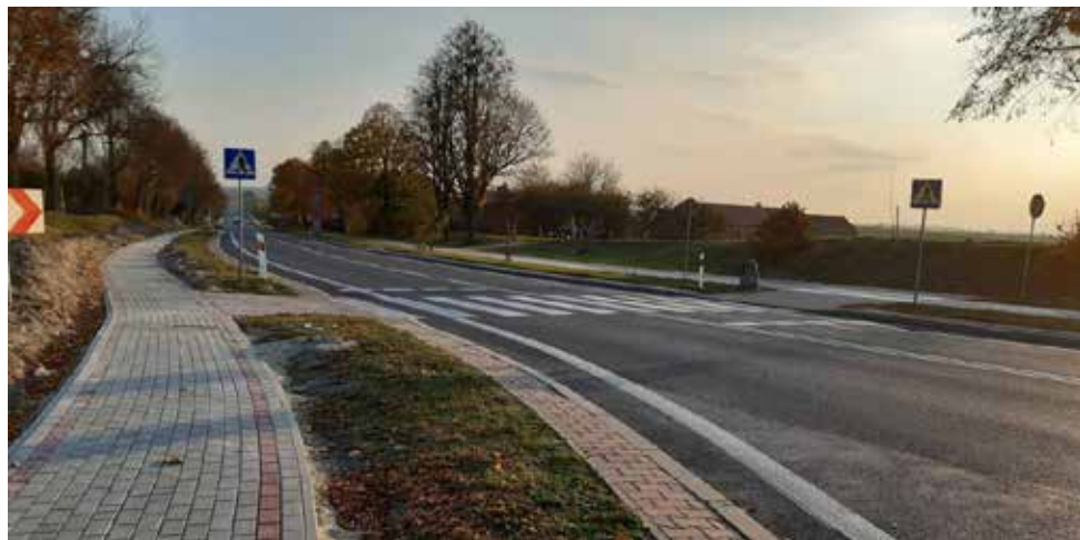
Ul. Żeromskiego ma już nowy chodnik

Jedne inwestycje są w trakcie, inne się już zakończyły. Pod koniec listopada drogowcy zakończyli prace remontowe ul. Berka Joselewicza. Robotnicy wymienili krawężniki, poprawili chodnik oraz wykonali nową nawierzchnię betonową. Remont kosztował 24 tys. zł.